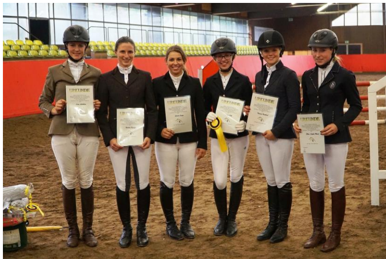
Die sechs besten Auszubildenden des Landesentscheids zum Berufswettkampf Reiten 2016