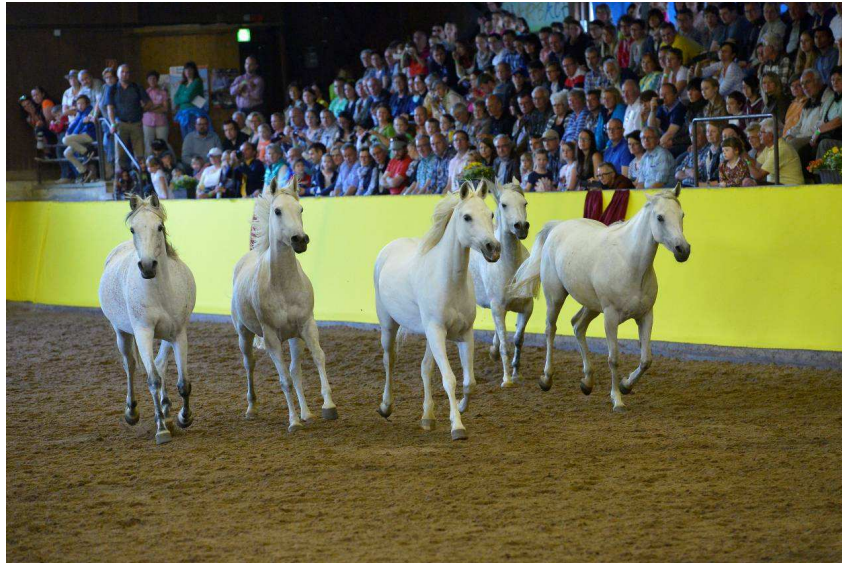
Freilaufende Araberstuten aus der Silbernen Herde in einem Schauprogramm des Haupt- und Landgestüts Marbach

Weitere Informationen zum Haupt- und Landgestüt Marbach finden Sie auf der Internetseite des Haupt- und Landgestüts Marbach: www.gestuet-marbach.de .