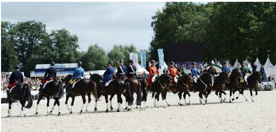
Quadrille der Deutschen Landgestüte beim Bundeschampionat 2012 in Warendorf

Der Gestütshof St. Johann ist das landwirtschaftliche Zentrum des Haupt- und Landgestüts Marbach. Eine gläserne Produktion gibt hier Einblicke in die Gewinnung der Futtermittel für die rund 550 Pferde des Gestüts. Zwischen dem Gestütshof St. Johann und dem traumhaft gelegenen Vorwerk Fohlenhof können Wanderungen und Kutschfahrten unternommen werden. Für das leibliche Wohl sorgt hier der Gestütsgasthof St. Johann.