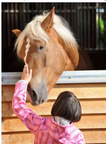
Pferde hautnah erleben im Haupt- und Landgestüt Marbach