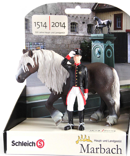
Schleich Sonderedition zum Jubiläumsjahr 2014

Geöffnet hat auch der Treffpunkt Marbach, das Besucherinformationszentrum im Gestütsinnenhof. Hier erfahren Besucher allerlei Wissenswertes über das Gestüt und die Region. Im Gestütsshop können Tickets für die Gestütsführungen und schöne Erinnerungen für zu Hause erworben werden, wie z.B. ein Original-Hufeisen eines der Gestütspferde. Außerdem ist ab sofort die Schleich-Sonderedition zum Jubiläumsjahr 2014, ein Set aus einem Original-Marbacher Gestütswärter und einem Schwarzwälder Landbeschäler in einer besonders gestalteten Verpackung, erhältlich. Der Gestütsshop ist in den Ferien täglich von 10-17 Uhr geöffnet.