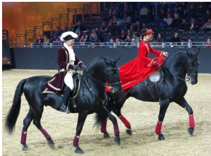
Altkladruber Rappen aus dem tschechischen Nationalgestüt Kladruby auch zu Gast bei Marbach Classics

Die europäischen Staatsgestüte gratulieren mit einem Festival der Gestütskultur. Mit ihren Pferden, Reitern und Fahrern tragen sie den europäischen Gedanken auf die Schwäbische Alb. Im Rahmen der Marbach Classics präsentieren sie die Vielfalt der Pferderassen, von mächtigen Arbeitspferden über seltene Spezialrassen, die einst zur Repräsentation an kaiserlichen Höfen gezüchtet wurden, bis zu modernen Sportpferden. Die Besucher erleben eine musikalische Zeitreise durch 500 Jahre Geschichte, in denen der Hufschlag des Pferdes das Tempo in Krieg und Frieden, auf Reisen, in der Landwirtschaft und bei gesellschaftlichen Anlässen bestimmte. Temperamentvolle Weil-Marbacher Vollblutaraber, barocke Lipizzaner und prächtige Altkladruber sind nur einige Höhepunkte dieses Sommernachttraums.