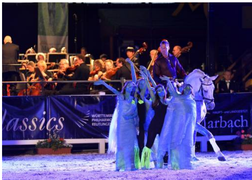
Anmutige Shownummern zu klassischer Musik: Das Programm der Marbach Classics begeistert das Publikum jedes Jahr aufs Neue