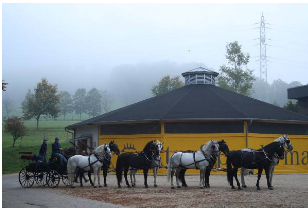
Achterzug mit Altkladruher Hengsten