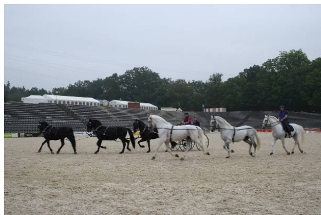
Random-Training, Foto: Alexandra Lotz