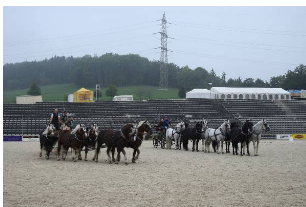
Training der Achterzüge, Foto: Alexandra Lotz