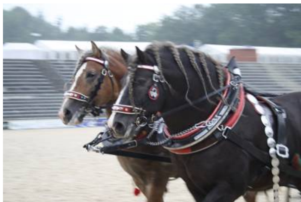
Böhmisch-Mährische Kaltbluthengste aus Tlumačov, Foto: Alexandra Lotz

Die Marbacher Hengstparaden finden mit freundlicher Unterstützung der Stuttgart German Masters, der OUTLET CITY METZINGEN, der Biosphären-gastgeber und der Berg Brauerei statt.