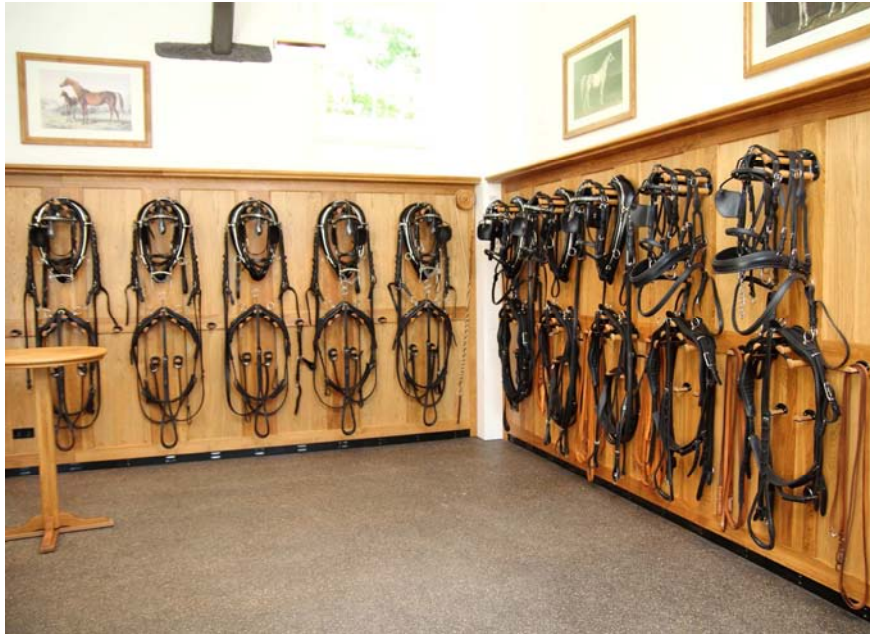
Aus Mitteln des Fördervereins Marbach gestaltet: Die neue Geschirrkammer

Auch bei der Marbacher Hengstparade 2013 werden einige dieser eleganten Geschirre sowie rasante Reiter und Pferde zu sehen sein. Die Hengstparaden als Pferdefest für die ganze Familie finden am 29.9., 3.10. sowie 6.10. in der Marbacher Arena mit Beteiligung des Gastlandes Tschechien statt. Eintrittskarten über EasyTicketService: Telefon (07 11) 2 555 555.