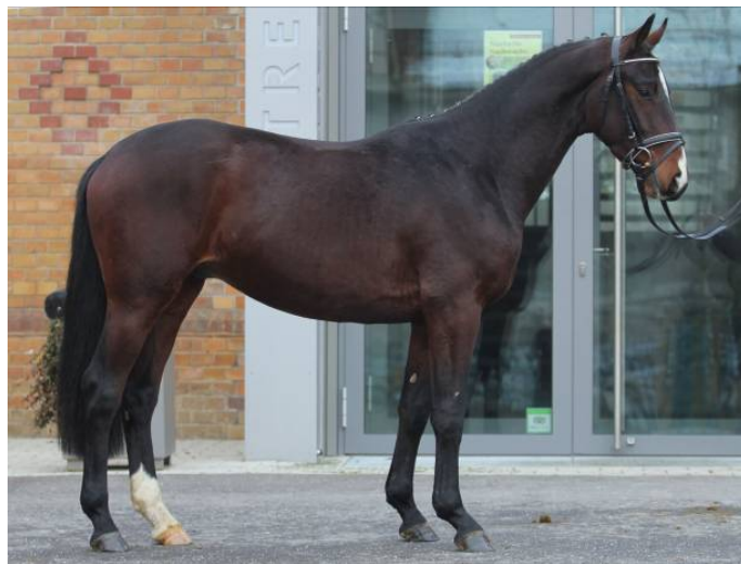
Schon gut entwickelt und bewegungsstark: Der dreijährige Sohn des Trakehner Siegerhengstes 2008, Inspektor von ISKANDER/T.