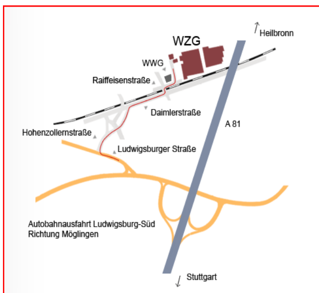
Autobahn A 81

Württembergische Weingärtner-Zentralgenossenschaft eG (WZG) Raiffeisenstraße 2, 71696 Möglingen