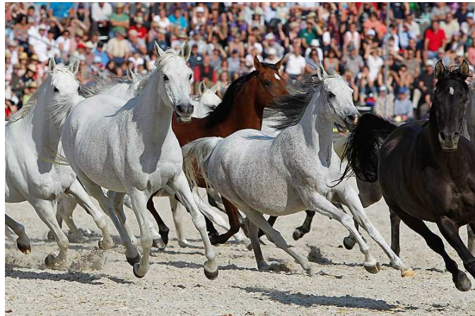
Kraft, Eleganz und Schönheit: Die „Silberne Herde“ Marbachs rührt manche Besucher zu Tränen

Die Veranstaltungen beginnen um 12 Uhr, das Gestüt ist aber schon ab 10 Uhr geöffnet, so dass genügend Zeit bleibt dem Platzkonzert im Gestütshof zu lauschen und durch die Verkaufsausstellung zu schlendern. „Hochgenuss auf schwäbisch“ lautet das Motto der Biosphärogastgeber, die mit Produkten aus der Region für das leibliche Wohl sorgen.