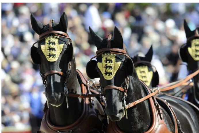
Im Zeichen des Landesjubiläums: das diesjährige Motto lautet „60 Jahre Baden-Württemberg“

Während Pferde vor 60 Jahren als Arbeitstiere noch zum täglichen Leben gehörten, sind sie heute zu einem wertvollen Sport- und Freizeitpartner geworden. Gemeinsam mit dem Landesbauernverband zeigt das Gestüt in lebendigen Bildern die Entwicklung von „echten“ Pferdestärken bis zu modernen Maschinen in der Landwirtschaft und vom schweren Arbeitspferd bis zum eleganten Sportpferd. Die Polizeireiterstaffel Stuttgart demonstriert eindrucksvoll den Einsatz der Pferde im Polizeidienst und wird so manchem Besucher den Atem rauben.