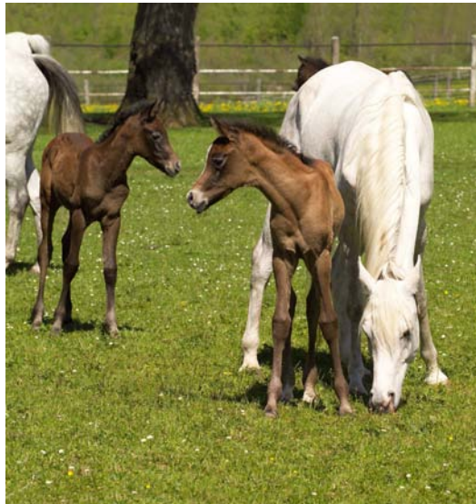
Mit etwas Glück sind in den Osterferien auch schon ein paar Fohlen auf den Weiden.

Die Führungen durch die ausgedehnten Stallungen des Gestütshofs Marbach mit kinderfreundlichen und fachkundigen Informationen zu den Pferden und der Arbeit im Haupt- und Landgestüt sind ideal für einen Ferientag im Herzen des UNESCO-Biosphärengebiets Schwäbische Alb. Start der Führungen ist jeweils um 13.30 Uhr, bei Bedarf noch einmal um 15.00 Uhr. Treffpunkt ist am Stutenbrunnen im Innenhof des Gestütshofs Marbach, eine Anmeldung ist nicht erforderlich.