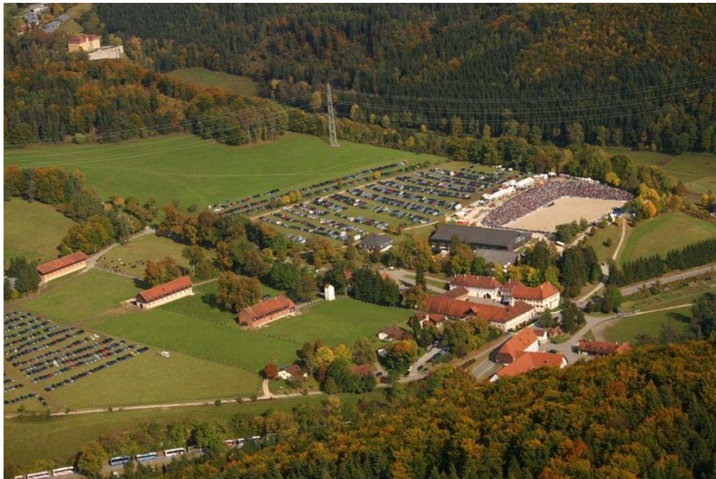
Tausende PKW und viele Reisebusse auf dem Weg zur Hengstparade: Rechtzeitige Anreise nach Marbach lohnt sich nicht nur wegen des Rahmenprogramms