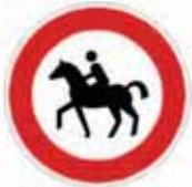
Verbot für Reiter

Zeichen 250 mit Zusatzschild „Reiter“: Das Verbot gilt nur für Reiter