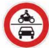
Verbot für Kraftfahrzeuge