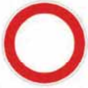
Verbot für Fahrzeuge aller Art